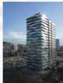
Традиционная архитектура встречает современную жизнь в Северном Кипре