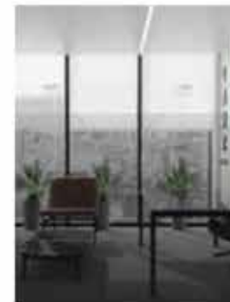
Коммерческие офисы в Шанхай с уникальным дизайном