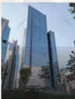
Готовые офисы Доступны для продажи