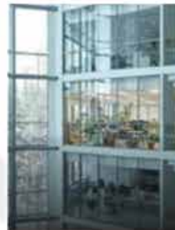
Премиум бизнес Офисы на продажу