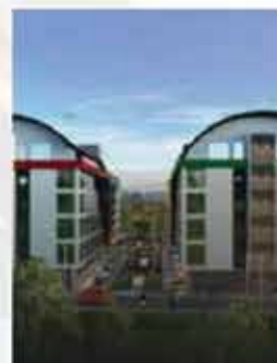
Живите в своей мечте Дом в столице Эгейского моря