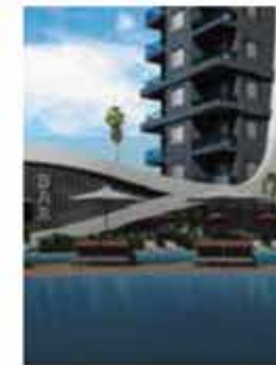
Удивительная концепция от Альтаир Резиденс