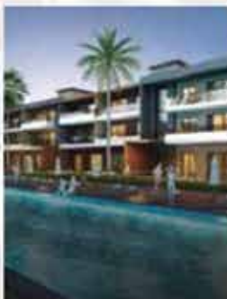
Откройте двери для Великолепной жизни в Измире