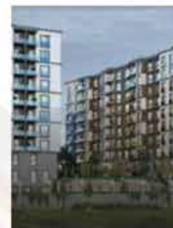
Адахан 150 Проект