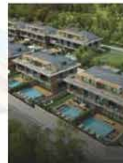
Проект виллы, предлагающий вам комфортное пространство и покой.