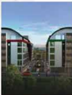
Коммерческий бизнес Офисы на продажу (Прямое Расположение)